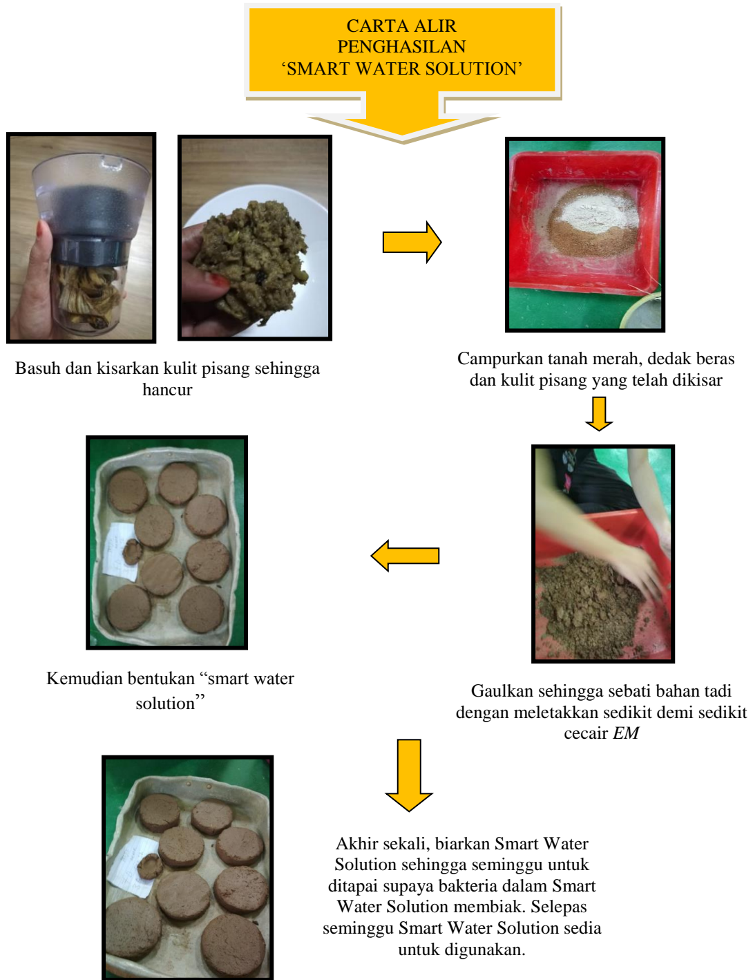
Rajah 3.2 : Carta Alir Penghasilan 'Smart Water Solution'